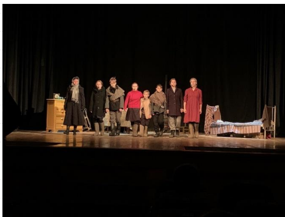
Заключительная сцена постановки