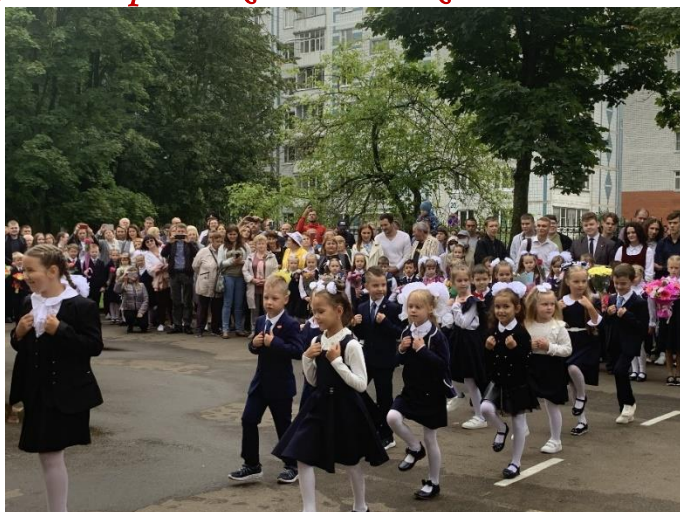
Зажигательный танец первоклашек