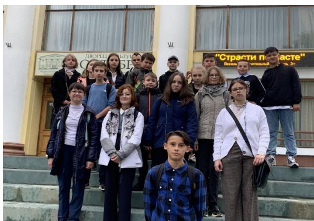
Учащиеся 7 «А» класс перед началом спектакля