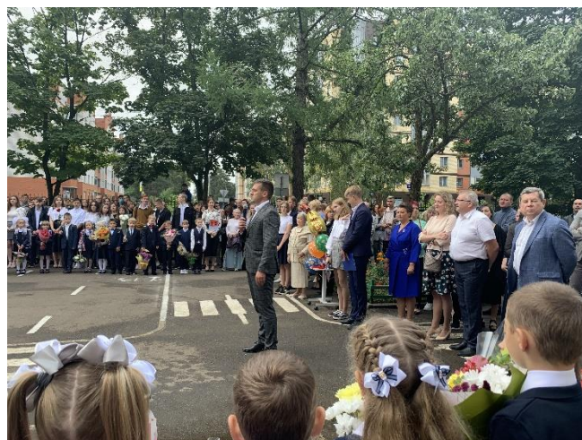
Выступление почетных гостей на торжественной линейке