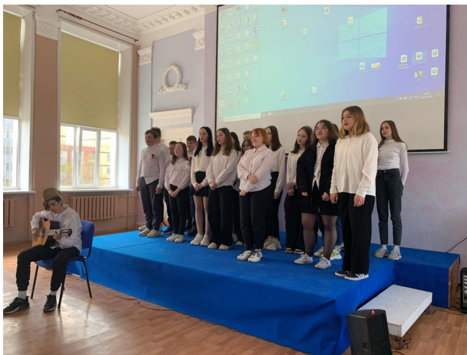
Выступление учащихся 7 «А» класса с песней «Эх, дороги..»