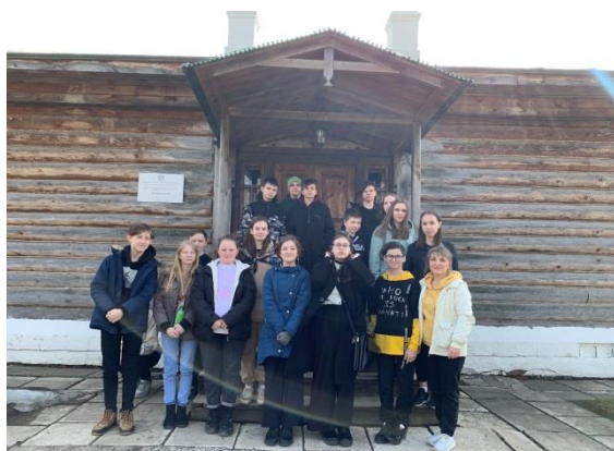
Спас-клепиковская школа, где учился Сергей Есенин