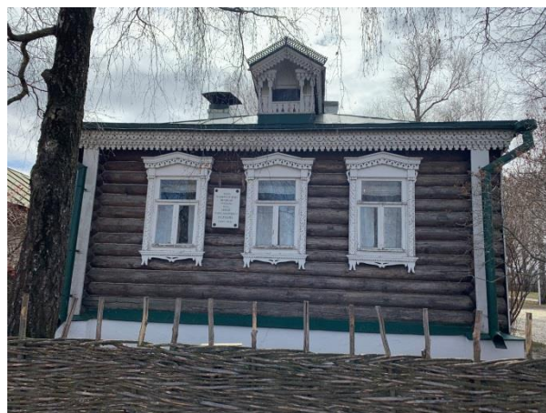
Дом родителей Есенина