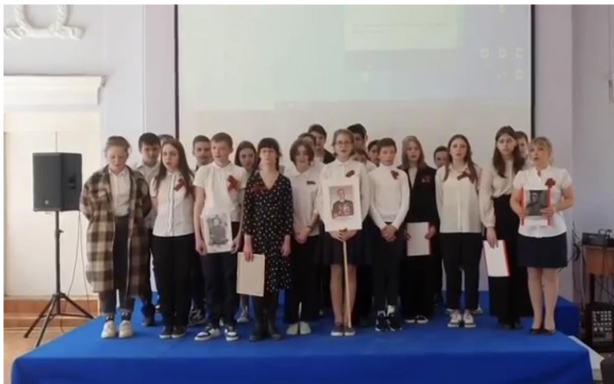
Выступление учащихся 7 «Б» класса. С песней «О той весне»

Война и песня! Что может быть общего? Именно в военной песне отразилась душа народа, его страдания и надежды. В преддверии великого праздника в нашей школе прошла еще одна акция «Песни великой Победы» . В хоровом исполнении прозвучали песни военных лет и песни, созданные в мирное время. Компетентное жюри оценило по достоинству выступление каждого класса.