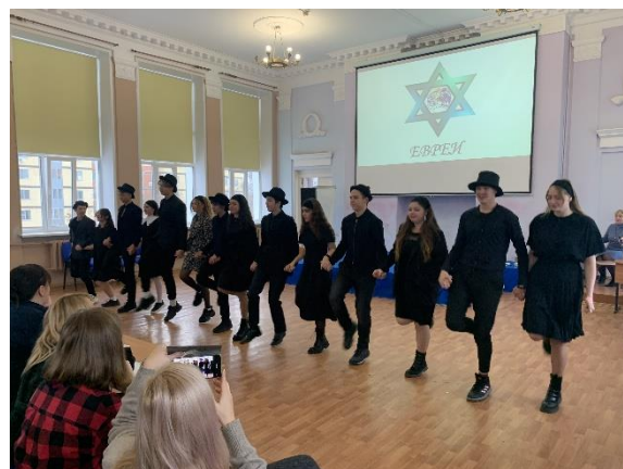
Зажигательный еврейский танец от 10 А