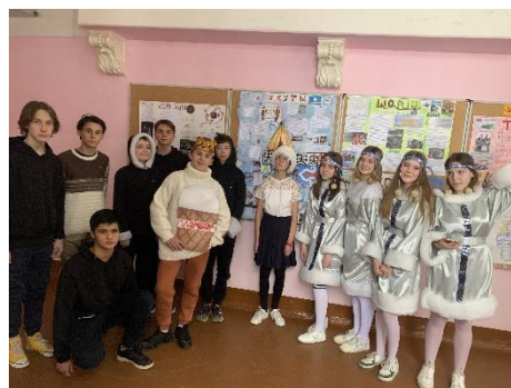
8Б представляли Якутию