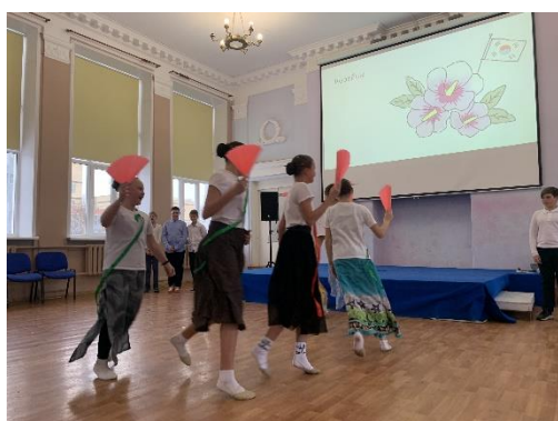
Танец корейнок от 6Б