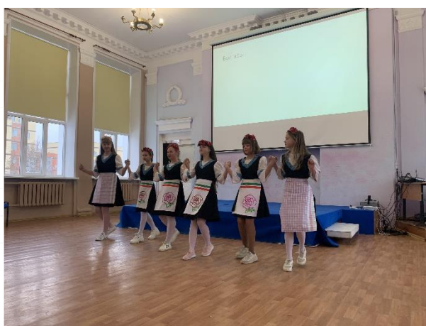
Болгарский танец от 5А