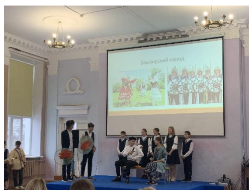
Башкирскую народную сказку показал 6А